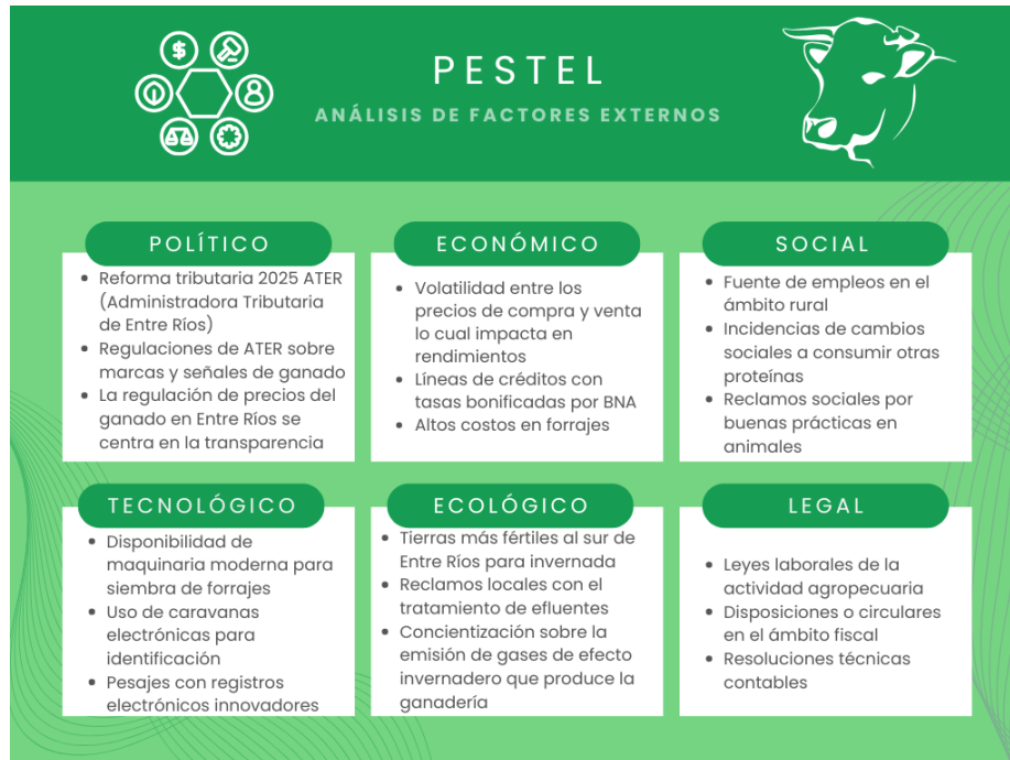
Gráfico N°1: análisis PESTEL

Cuadro de elaboración propia a partir de fuentes bibliográficas