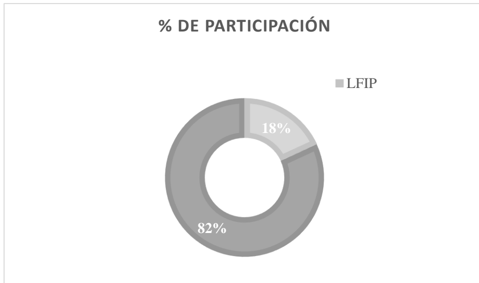
Figura 2. Línea de Financiamiento para la Inversión Productiva.