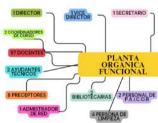
Ilustración 2 Planta Orgánica Funcional de la Institución

En el caso del Equipo de Gestión de esta escuela, el carácter de los cargos es suplente en ambos casos, la Dirección y Vice Dirección, si bien no tiene gran incidencia en la forma de liderar o gestionar una escuela, la estabilidad laboral, también forma parte de un sentido de pertenencia institucional.