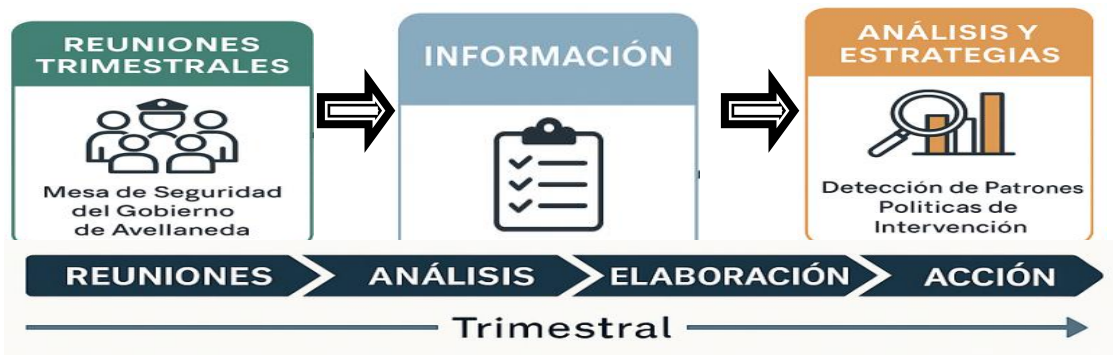
Figura 1 (elaboración propia) Diagrama de trabajo

seguridad, ONG, establecimientos escolares, salud, poder judicial y comunidad en general, utilizando un anexo estructurado para la obtención de información.