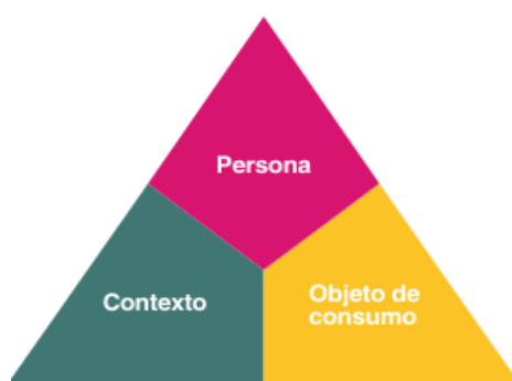
Figura 3. Triángulo de Zimberg (1984) extraído de “Equipo ámbito de prevención comunitaria”, (2023).

Continuando con esta línea de pensamiento, el Equipo Ámbito de Prevención Comunitaria (2023) enfatiza que entender completamente una situación de consumo problemático resulta imposible si se consideran de manera aislada cada una de las tres dimensiones. Es esencial examinar la interacción entre estas dimensiones para una comprensión más profunda de la práctica del consumo, incluyendo todas sus particularidades, lo que permite elaborar estrategias de intervención adecuadas. Además, el Equipo Ámbito de Prevención Comunitaria (2023) sugiere que una herramienta eficaz para abordar esta problemática desde la perspectiva de la complejidad es el Triángulo de Zimberg (Zimberg, 1984), el cual propone un enfoque multidimensional de los consumos. Enfocarse únicamente en una de las variables resulta insuficiente para observar, acompañar y diseñar estrategias de prevención y cuidado. Por lo tanto, no se puede ver las dimensiones en forma aislada para abarcar una situación de consumo problemático.