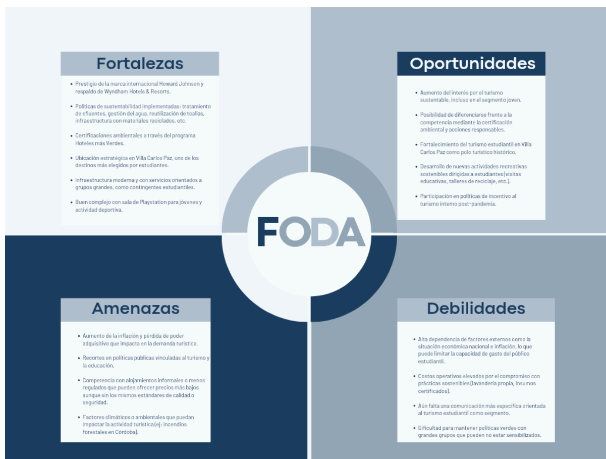
Gráfico 1: elaboración propia

El análisis FODA nos permite realizar una evaluación diagnóstica del objeto de estudio y se puede implementar una planilla que considerará, como nos indica la sigla, analizar las Fortalezas, Oportunidades, Debilidades y Amenazas en el interior y exterior de una organización, pyme o empresa.