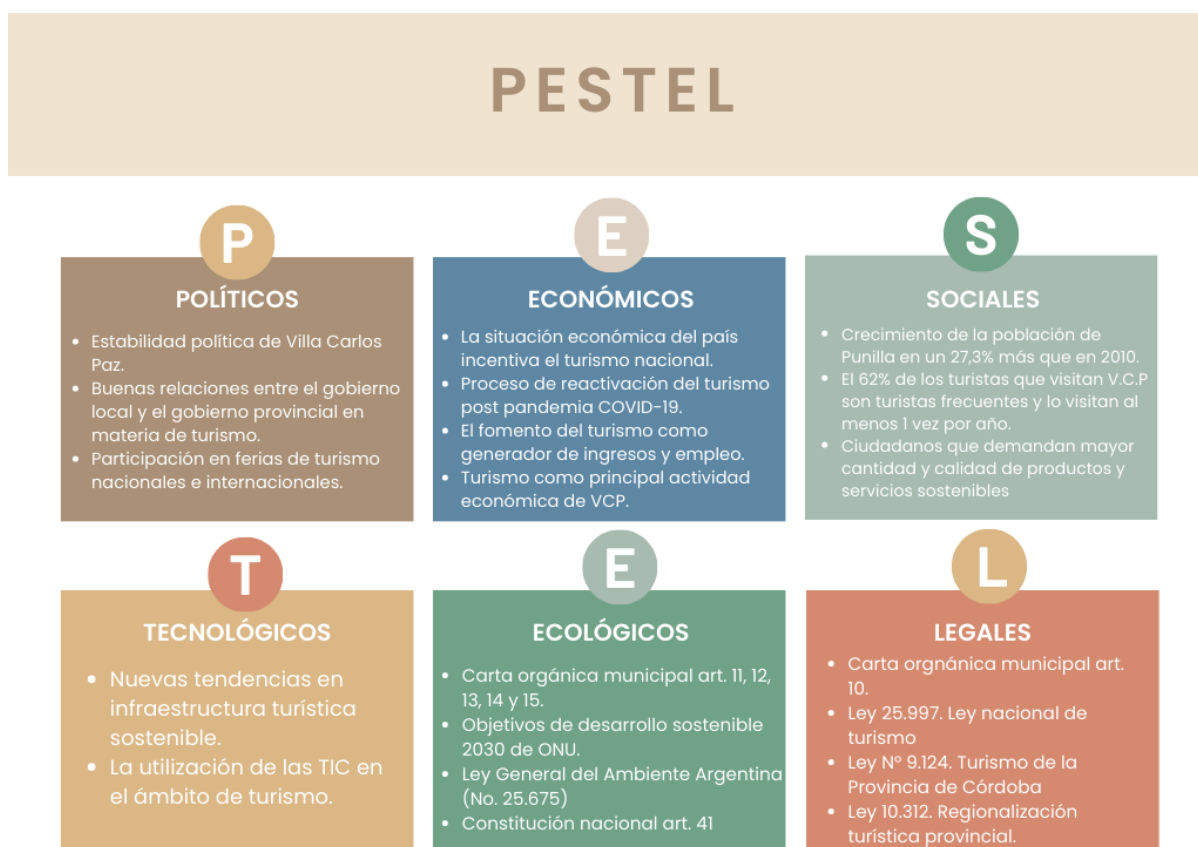
Tabla 1. Análisis PESTEL

El análisis PESTEL es una herramienta que analiza el impacto de los factores del entorno en la institución que estamos analizando. En la siguiente tabla se muestra el análisis y luego se explican los ítems en detalle.