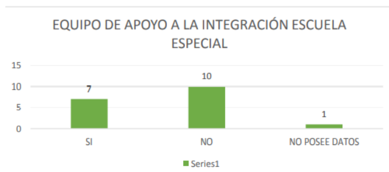
Gráfico N° 2

En la Tabla N° 1 podemos observar la distribución de los estudiantes con NEDD por curso como así también el total de los mismos en la institución durante el ciclo lectivo 2018 arrojando un total de 18 estudiantes con NEDD (Necesidades educativas derivadas de la Discapacidad).