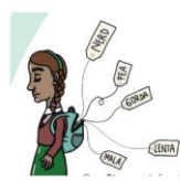
Kaplan C. V., Szapu E. (2020)

La escuela es un espacio que, en determinadas condiciones institucionales y pedagógicas, puede abrir horizontes y renovar esperanzas, incluso en contextos adversos. Las instituciones educativas ocupan un lugar importante en la sociedad. La dimensión afectiva juega un papel predominante, ya que es necesario que las infancias y juventudes se sientan reconocidas en la escuela. Los vínculos y las emociones en la escuela son importantes y deben ser tenidos en cuenta como espacios de socialización. El reconocimiento y la aceptación de los demás son fundamentales para la construcción de la identidad y el sentido de la vida. El sujeto se constituye a través de las relaciones interpersonales y culturales, necesitando el reconocimiento de los demás para existir y desarrollarse. Como espacio significativo de socialización, la escuela tiene una fuerte influencia sobre las emotividades que allí se tejen y entretienen.