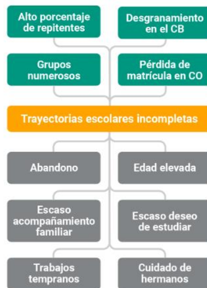
Cuadro 3: Factores que influyen en el índice de deserción escolar