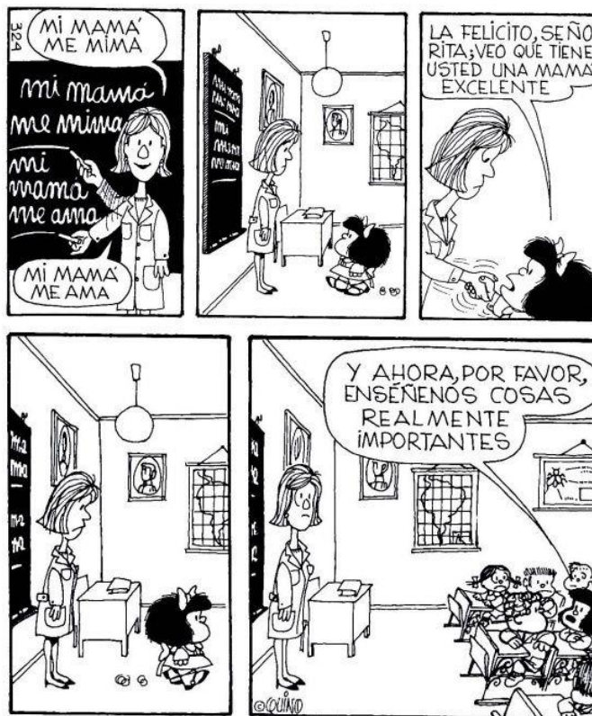
Imagen 1. Mafalda y la escuela.