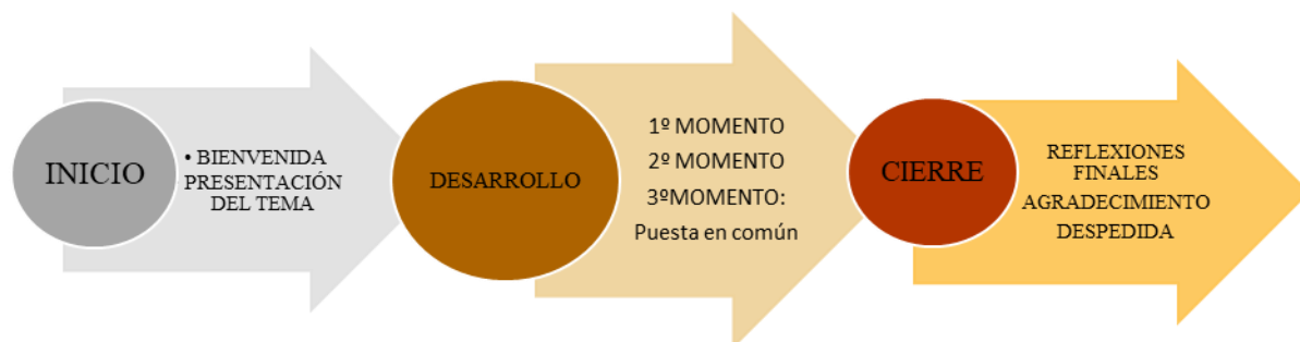
*Esquema 2: Secuencia didáctica, elaboración propia

Cada taller se trabajará con la siguiente secuencia: