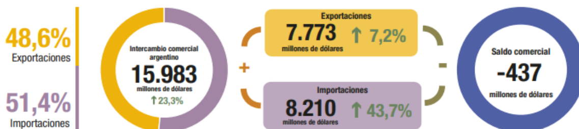
Imagen 2. Intercambio comercial argentino.

En el siguiente cuadro se pueden observar los valores de las importaciones y exportaciones argentinas y el saldo de la balanza comercial.