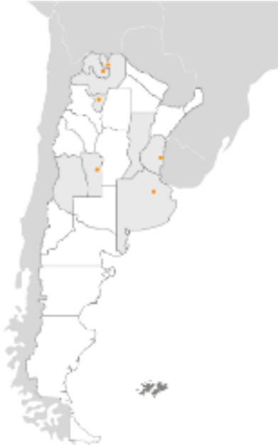
Imagen 1: Localización de los Negocios de la Empresa