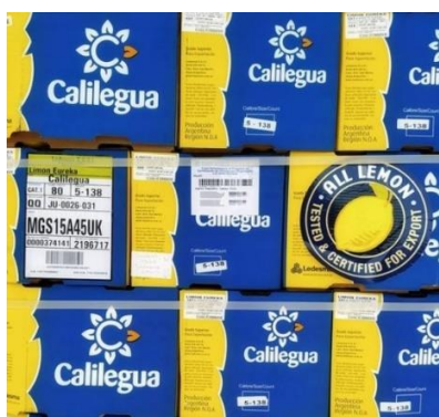
Imagen 13: Empaque para exportación

Para el envío a Chile, se exportarán 2.835 kg de limones frescos, con un valor aproximado de 3700 USD, que irán distribuidos en 189 cajas de 15 kg cada una. La carga se realizará en 21 pallets con 9 cajas cada uno. El medio de transporte seleccionado será terrestre, específicamente, en camión, ya que el país de destino es limítrofe (Libertador San Martín, Jujuy - Santiago de Chile). El contenedor seleccionado para la carga es un Dry de 40 pies.