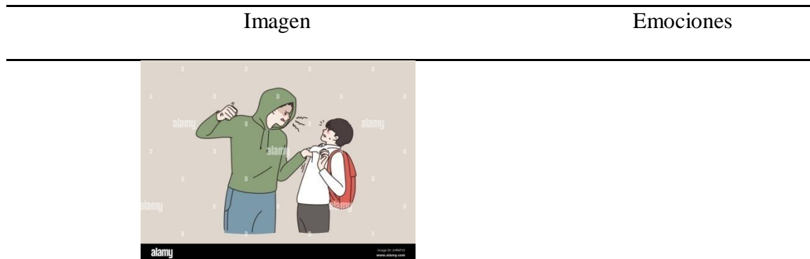
Figura 1. Violencia escolar.