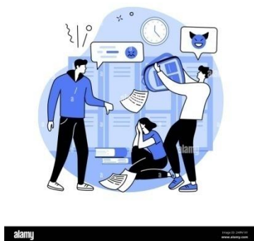
Figura 2. Burlas en la escuela. Fuente: alamy, (2021)