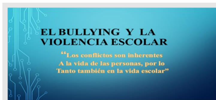
Figura 3: Elaboración propia (2022)

https://docs.google.com/presentation/d/1z9NriRlQ7PX5nhrZmMQAW73y1y_c2k04/edit?usp=sharing&ouid=109560601153395283735&rtpof=true&sd=true