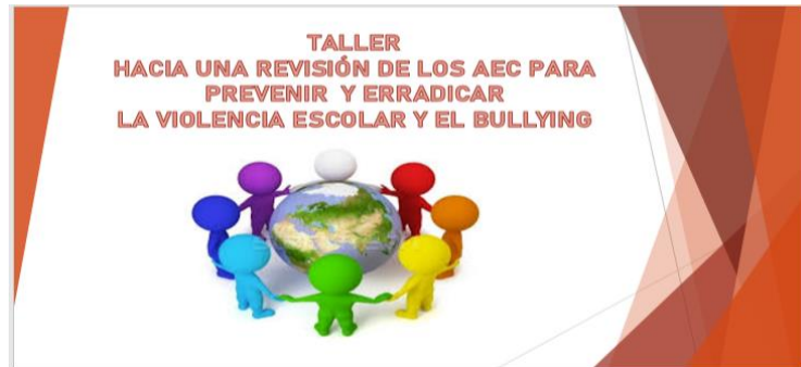
Figura I: Elaboración propia (2022)

https://docs.google.com/presentation/d/1iBoAZzGu0gTYudU5eQsb8S6iISxJ2jLx/edit?usp=sharing&ouid=109560601153395283735&rtpof=true&sd=true