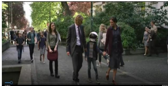
Figura 4: Youtube: Stephem Chbosky (2017). Extraordinario .

Luego de exposición de los cortometrajes, la asesora realizará diferentes preguntas sobre los misma, generando espacios de debates y reflexiones, como, por ejemplo: