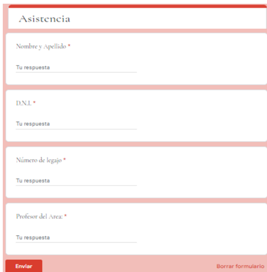
Figura 3: Registro de asistencia.

https://docs.google.com/forms/d/e/1FAIpQLSc6KE1BdIo-5Vq7JXwCgOa1iNL3uVGLOgFRYwjcEC-xqRhNvg/viewform?usp=sf link