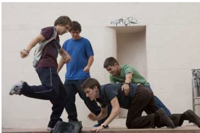
Imagen 2: Extraída de Película “Bullying”