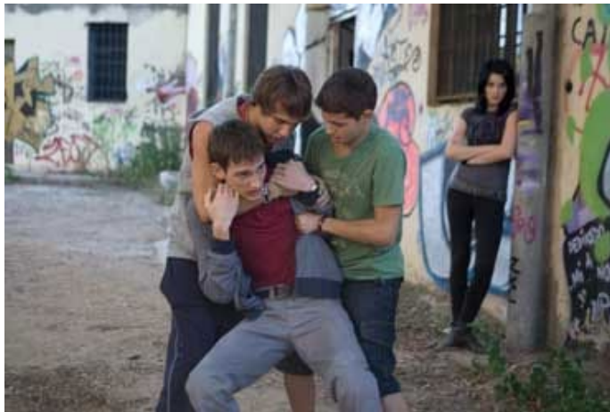
Imagen 1: Extraída de Película “Bullying”

Imágenes extraídas de la película “Bullying”