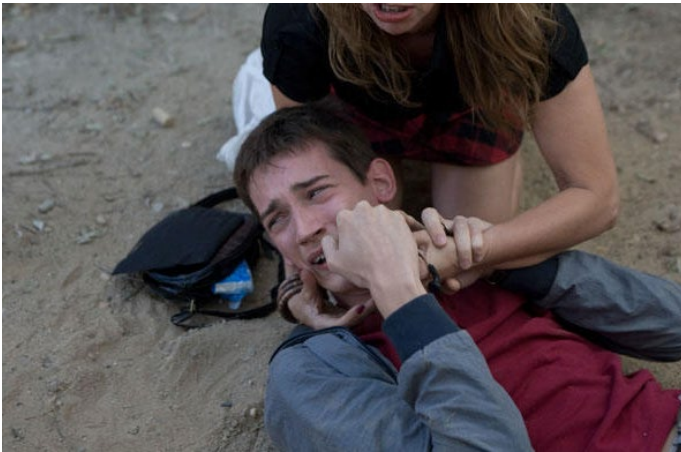
Imagen 3: Extraída de Película