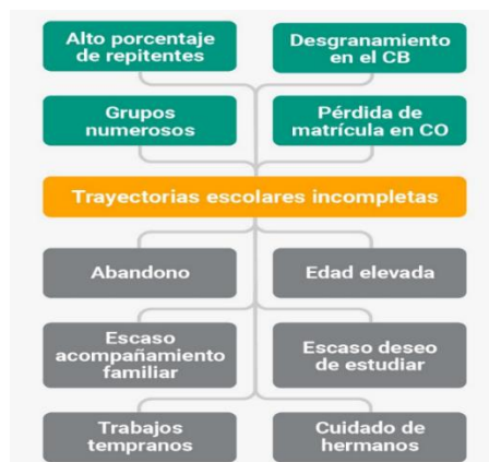
Figura 3: Árbol de problemas