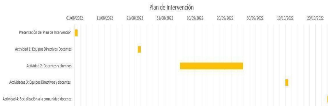
Diagrama de Gantt