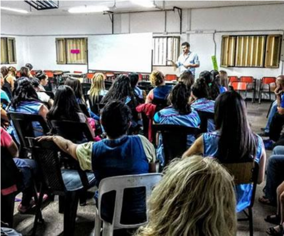
ALUMNOS DEL NIVEL SUPERIOR- Formación docente-