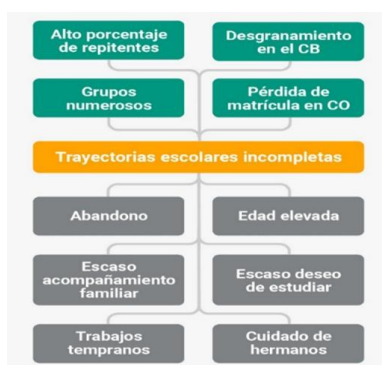
Figura 1: Árbol de problemas

A continuación, se puede ver la siguiente tabla que representa lo expuesto: Evaluación del Plan Gestión 2017.