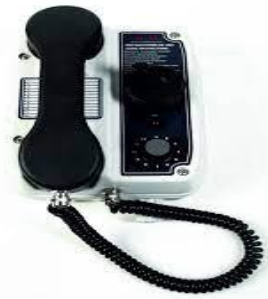
Teléfono autoexcitado con posibilidad de 12 extensiones

Para instalación de teléfonos autoexcitados: Cable de 4 conductores de 2,5mm de sección con cubierta aislante tricapa ignífugo o retardante al fuego. Artefactos de teléfonos autoexcitados de plástico reforzado fijos con toma para cabezales con 15mts de prolongación.