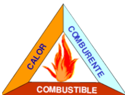
Triángulo y tetraedro del fuego

Existen tres componentes que, si se encuentran en proporciones adecuadas, en un momento dado originan la combustión. Generalmente, en los momentos iniciales, se visualiza en forma de humo y si continúa desarrollándose aparece la llama. Estos tres componentes originan un cuarto elemento que es la reacción química en cadena que es el fenómeno que permite que continúe ocurriendo la combustión hasta que desaparezca por lo menos uno de estos componentes. Es decir, resumiendo con uno de estos componentes que no se encuentre presente no se puede originar la combustión. Dentro de los tipos de incendios existen: