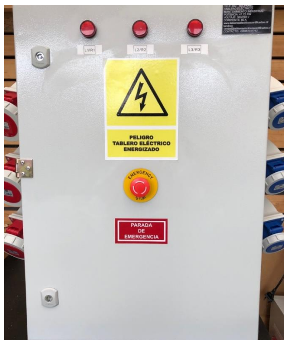
Imagen 2 de https://www.weg.net

Tablero eléctrico con pulsador montado para corte de emergencia