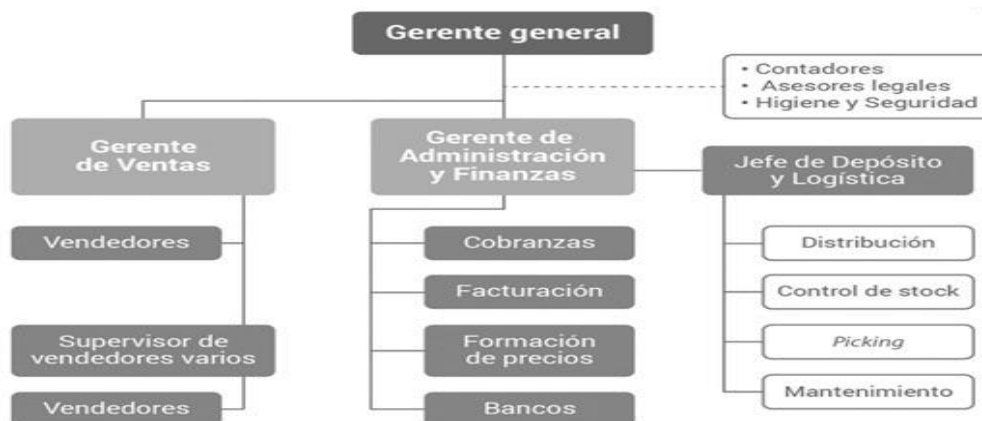
Figura 1. Organigrama funcional de la empresa Redolfi S.R.L.

A continuación, se expone un organigrama de la estructura organizacional de la empresa