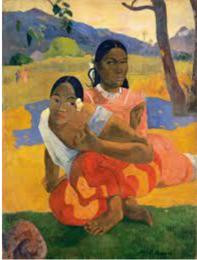
Gauguin, P (1892) ¿Cuándo te casarás? Basilea : Colección privada