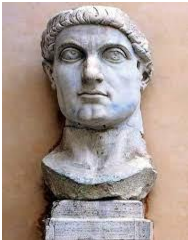
Anónimo (324-327) Cabeza de Constantino . Roma: Museo municipal.