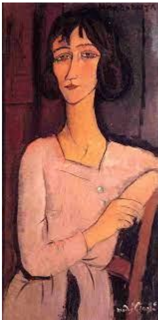
Modigliani, A (1916) Margarita . Colección privada