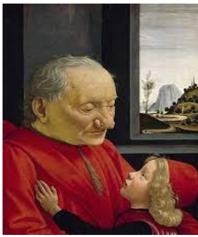
Ghirlandaio, D. (1490) Abuelo y nieto . Paris: Museo del Louvre