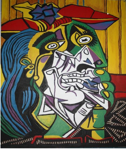
Picasso, P (1937) La mujer que llora . Londres: Museo Tate Modern.