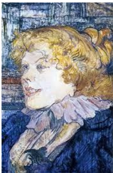
Lautrec, T (1899) La inglesa del star en le Havre . Albi: Museo Toulouse –Lautrec.