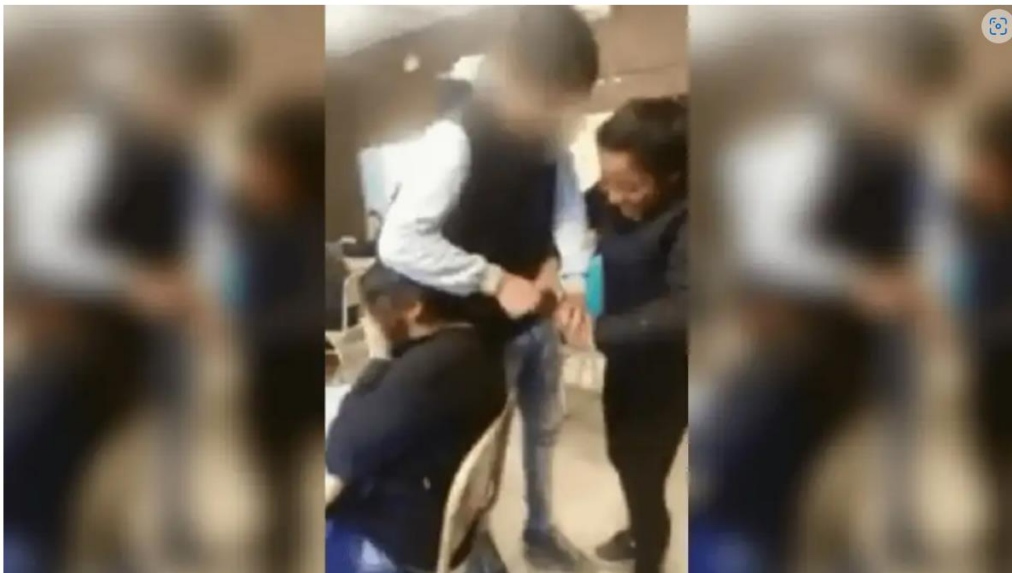
El caso de bullying ocurrió en la Escuela de Enseñanza Técnica N°674, de la localidad de San Genaro.

El caso ocurrió en una escuela de la localidad de San Genaro. Qué dijeron desde la institución educativa.