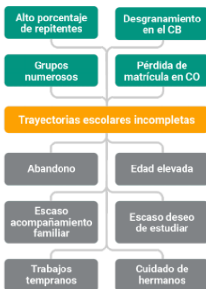
Gráfico N° 3: Árbol de problemas

institucionales, incipiente trabajo en equipo e integral de los docentes por cursos. Esta problemática la podemos observar claramente en el siguiente árbol de problemas: