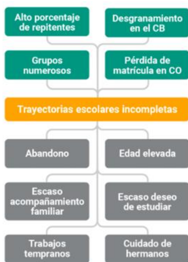
Figura 2. Árbol de Problemas Identificados en el I.P.E.M N°193 José María Paz. UES21, 2021.