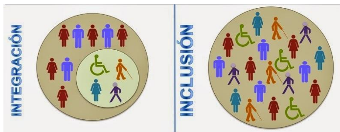
Imagen N° 2: Integración e incluso.