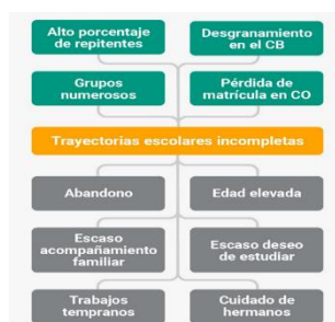
Figura 2: Árbol de problemas