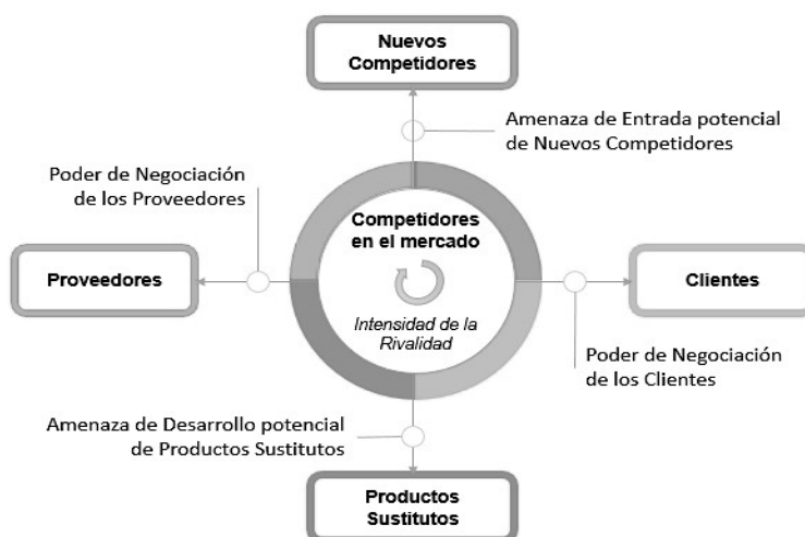
Figura 2. Esquema de las 5 fuerzas de Porter. Michael E. Porter, 2008.

De acuerdo con el autor, la competitividad en una organización estaría conformada por las 5 fuerzas fundamentales: