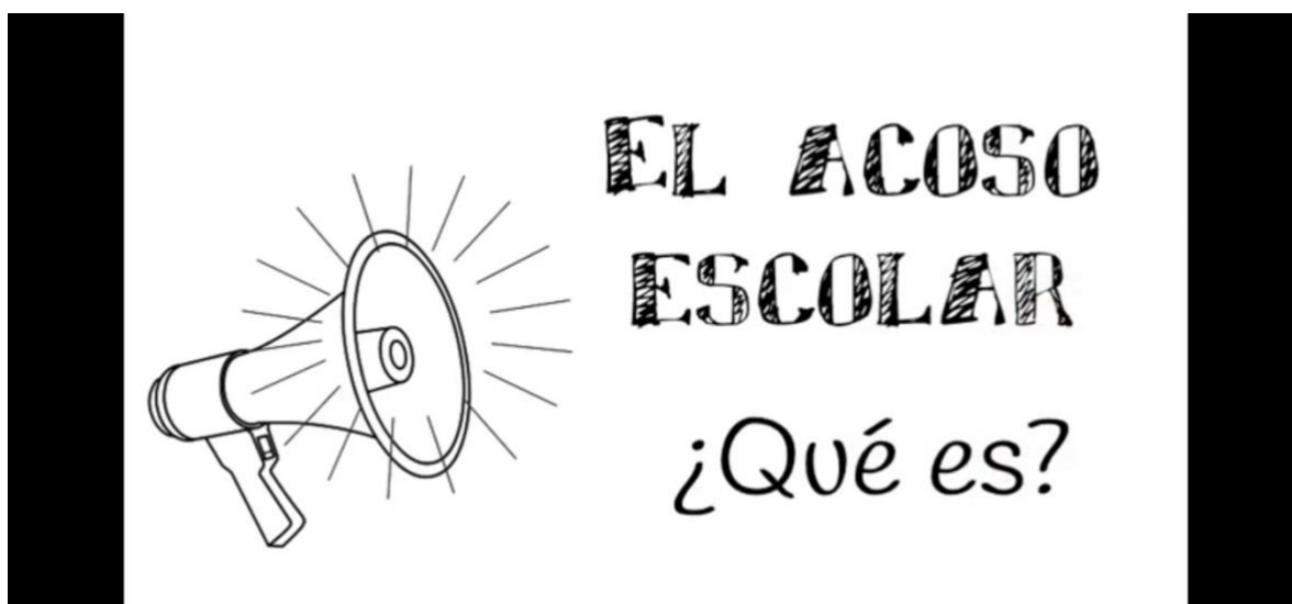
Anexo 5: Video