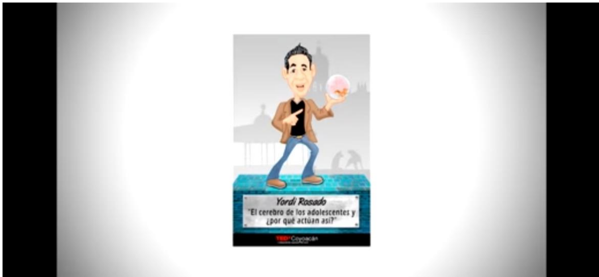
Anexo 6: Folletos