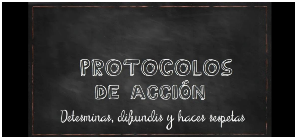
Anexo 4: Video para Padres.