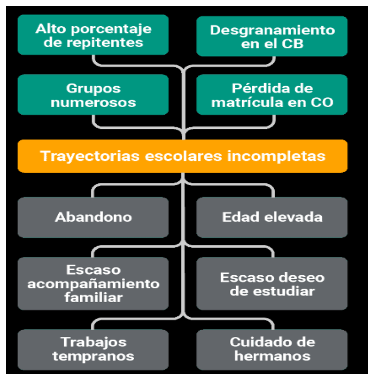
Figura 3: Árbol de problemas