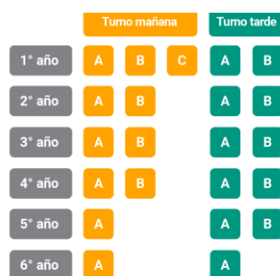
Figura 1: Divisiones por curso y turno.

La población escolar está conformada en un 75 % por habitantes de Saldán y en un 25 % por habitantes de localidades vecinas (La Calera, Dumesnil, Villa Allende, Arguello y Rivera Indarte).