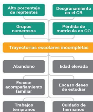
Figura 2: Árbol de problemas