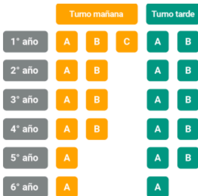
Ilustración 3 Cantidad de estudiantes por secciones.

desgranamiento del CB. En la siguiente figura se puede observar cómo en el turno mañana y tarde finalizan sus trayectorias escolares cuantitativamente en una sola división.