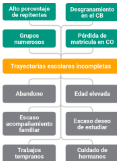
Ilustración 2 Árbol de problemas