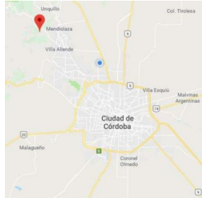
Figura 2: Google Maps, 2019.

Fuente: (Universidad Siglo 21, 2019a, pág. 5).