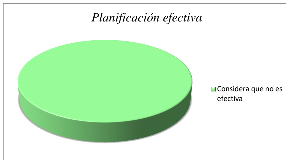
Figura 2: Información tabulada en correspondencia con la pregunta N°11 de la encuesta.

En las respuestas a la pregunta 12 de la encuesta vemos reflejado que si bien las docentes conocen necesidades y/o problemáticas de diversidad e inclusión