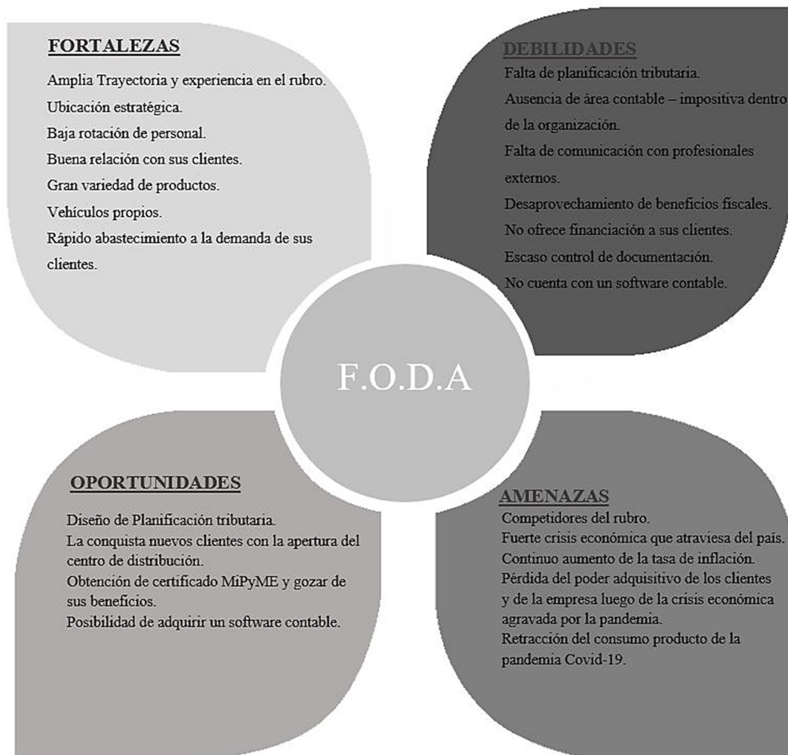
Figura 2: Análisis F.O.D.A