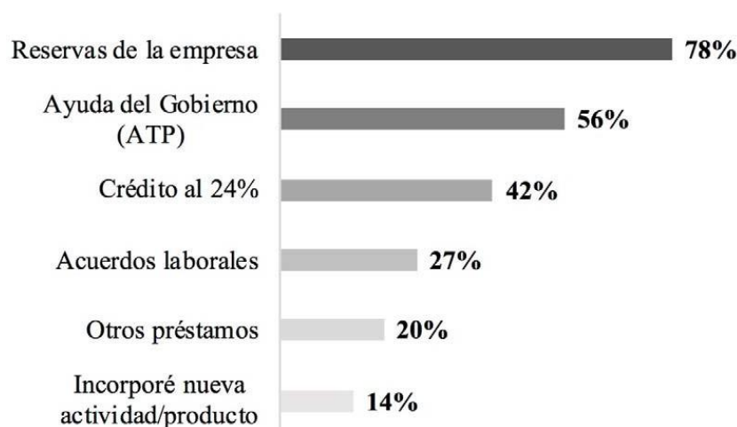
Figura 3. Medidas adoptadas por las empresas para enfrentar la baja de actividad(% de empresas)