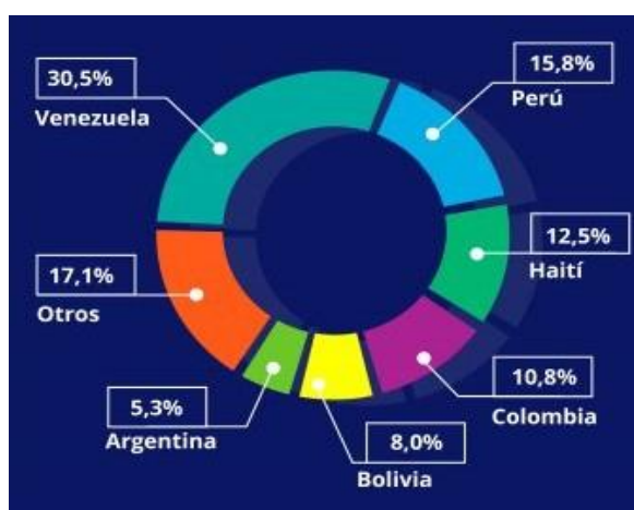
Ilustración 1 Porcentajes de distribución de migrantes en Chile según su nacionalidad

Nota: Recuperado de: https://www.migracionenchile.cl/poblacion/ (Datos a partir del INE y Departamento de Extranjería y Migración de Chile a diciembre de 2019)