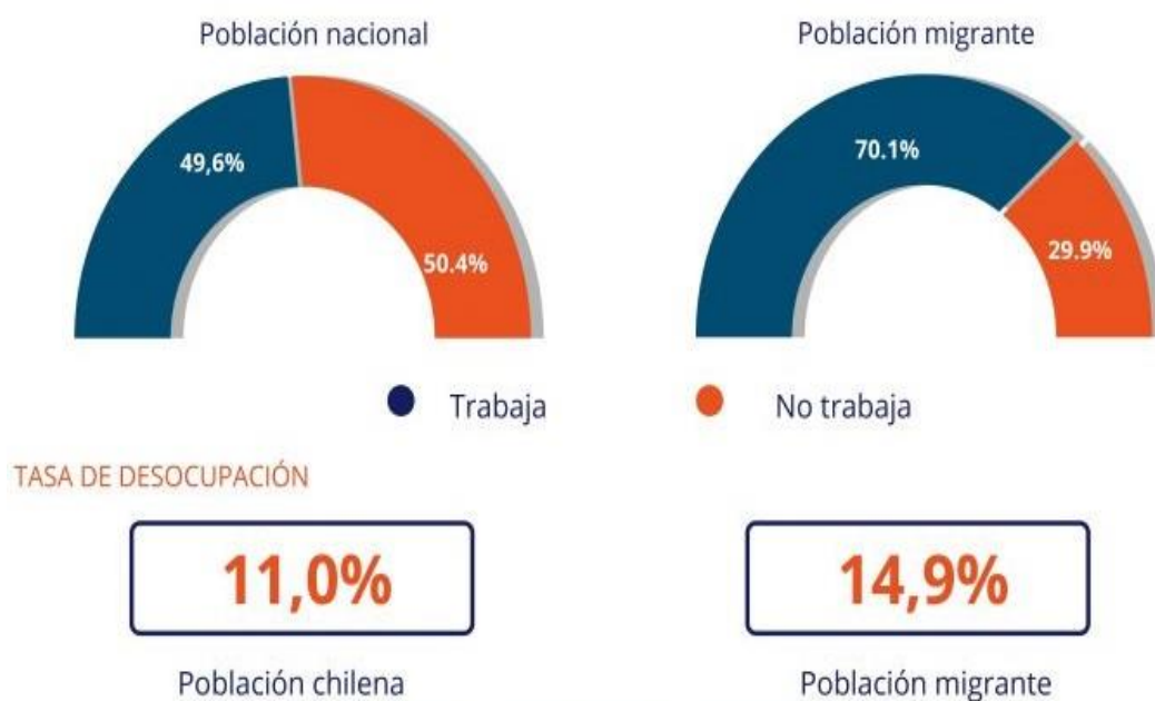
Ilustración 4 Tasa de participación laboral