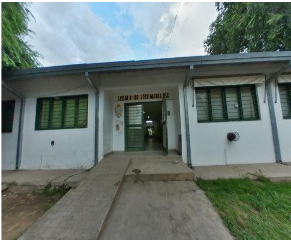
Imagen N° 1. I.P.E.M N° 193 José María Paz