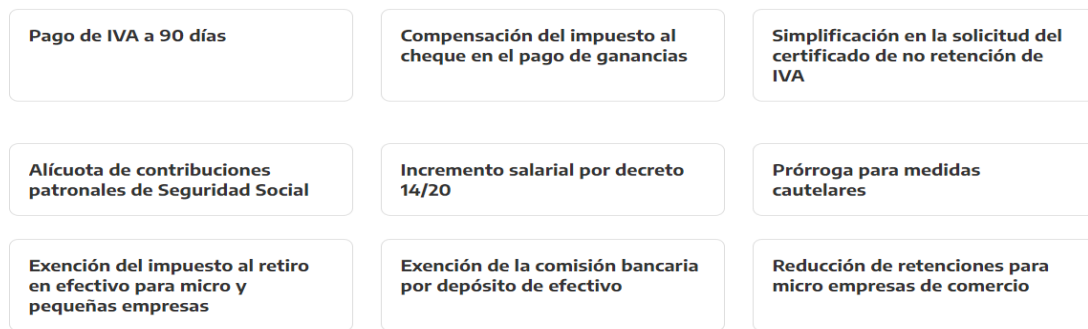
Figura V: Beneficios del Certificado MiPyME.

Accediendo al certificado MiPyME, y haciendo uso de los beneficios que otorga el mismo, Man-Ser SRL podrá hacer uso de los beneficios otorgados que le sean de utilidad, como por ejemplo: