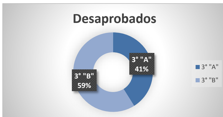
Figura N° 2