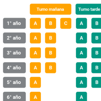
Figura N° 2: Conformación cursos

La institución tiene bien identificado que uno de los problemas centrales es el de las trayectorias escolares incompletas, caracterizadas por el abandono, la repitencia y la sobreedad. En el ciclo básico se evidencia un marcado desgranamiento, se puede observar claramente en el siguiente gráfico (Figura 2) que el turno mañana inicia primer año con tres divisiones, que luego a partir de 4to año solo queda conformada una sola división.