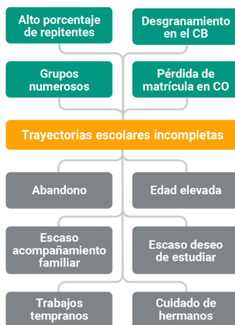
Figura 1: Árbol de problema