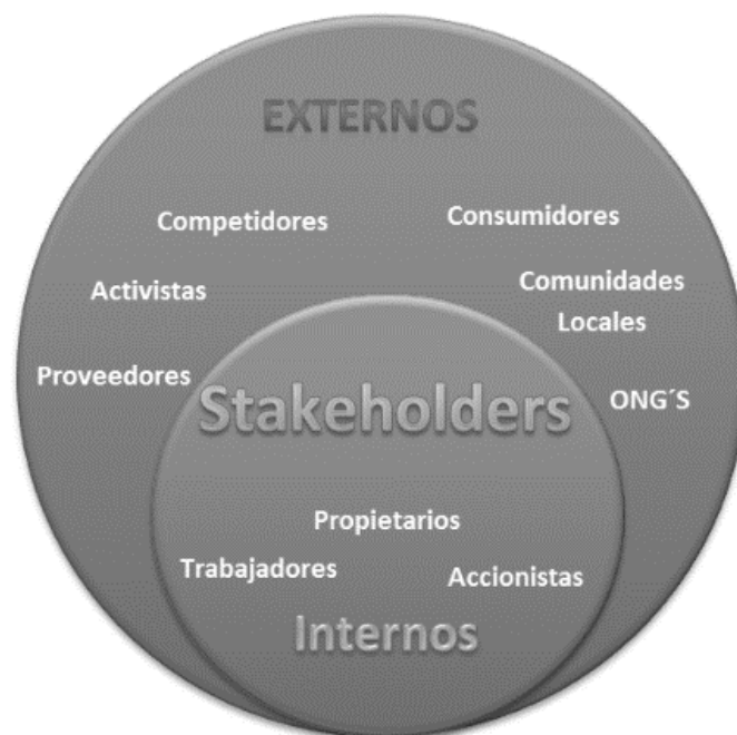
Figura 3. Stakeholders. Recuperado de Pérez Romero et al. (2015)

Los stakeholders son los grupos de interés de la empresa, es decir todas las personas que se ven afectadas por la empresa o que la afectan a ésta. Son considerados como un enfoque integrador que busca crear valor, satisfaciendo las necesidades de sus accionistas, y en la medida de lo posible las necesidades de todos aquellos que se ven afectados de forma directa o indirecta por las actividades de la empresa. Para identificarlos de mejor forma se dividen en actores internos y externos (Pérez Romero et al., 2015). En la Figura 3 Stakeholders, se expresa de manera figurativa la unión que existe entre todos los actores de la RSE.