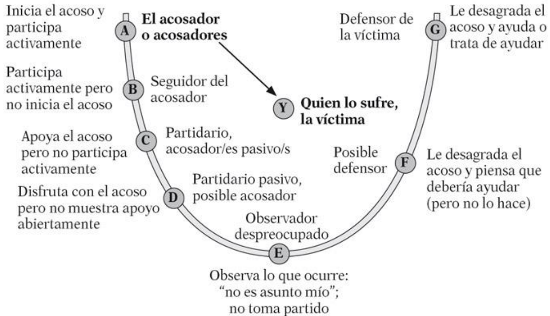
Anexo 1. Figura 1: “Círculo del Acoso Escolar”, de Olweus.

Anexo 2. Video 1. Link video “¿Qué es el acoso escolar?”: