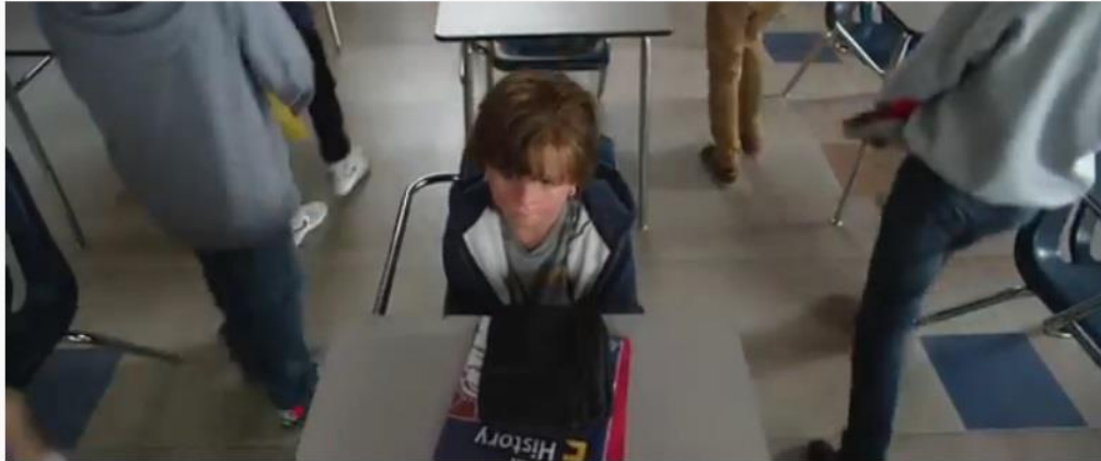
Extraordinario "Wonder" - Bullying escolar (2017)

Anexo 5. Video 4. Link video de fragmento de película “Wonder” (2017) en YouTube: https://www.youtube.com/watch?v=12hQ6-WtuJc