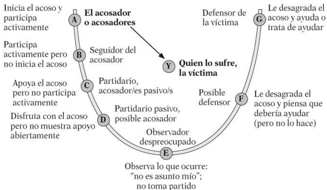
Anexo 1. Figura 1: “Círculo del Acoso Escolar”, de Olweus.

Anexo 2. Video 1. Link video “¿Qué es el acoso escolar?”: