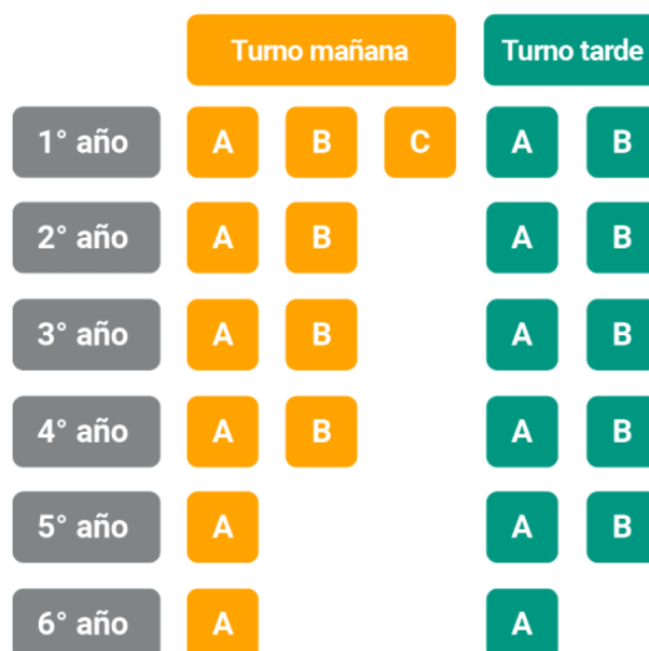
Figura 2: Divisiones por curso y turno