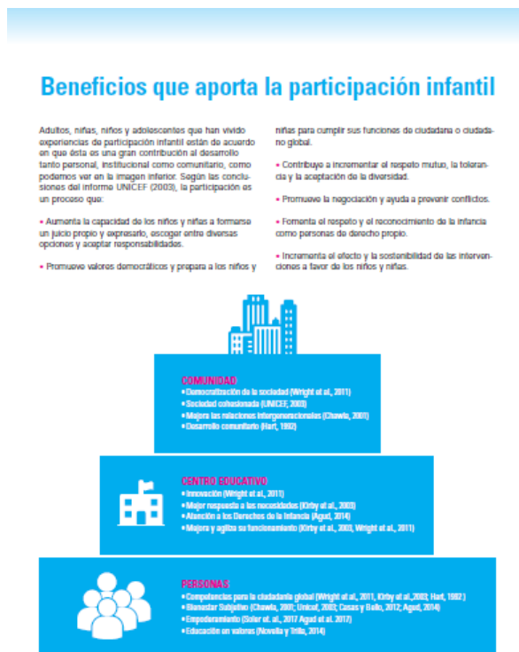
Imagen n°4 Beneficios de la participación.

Fuente, participación en los centros escolares extraído de http://www.unicef.es/educa/biblioteca/participacion-infantil-centros-escolares