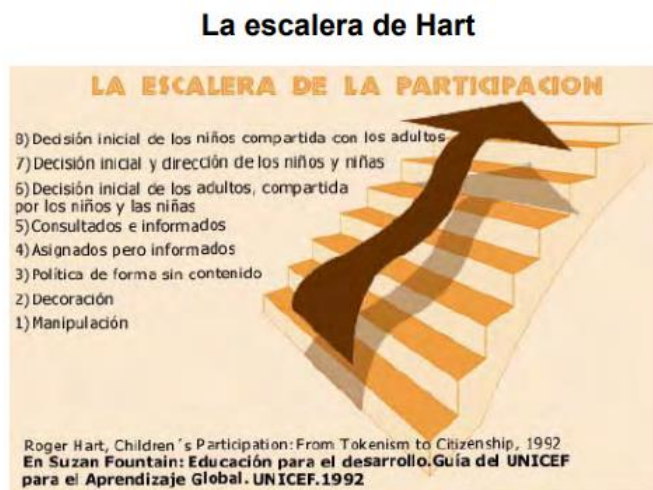
Imagen nº 3. La escalera de Roger Hart

Fuente participar también es cosa de niños, extraído de https://www.savethechildren.es/sites/default/files/imce/docs/guiaparticipacionvalencia.pdf