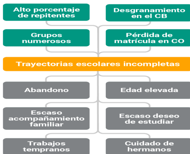
Figura 7: Árbol de problemas

Efectos : grupos numerosos con alto porcentaje de repitentes, pérdida de la matrícula en CO y desgranamiento del CB.