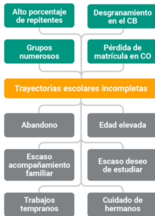
Figura 2: Problemáticas I.P.E.M. N°193 José María Paz

Con la información disponible de la institución y su análisis se observa que la misma está atravesando un nuevo paradigma social que la deja expuesta a múltiples problemáticas dentro de las cuales una de las que se manifiesta con mayor emergencia es la necesidad de prevenir el consumo problemático de sustancias en alumnos, para evitar el abandono del trayecto escolar (Universidad Siglo 21, 2019).